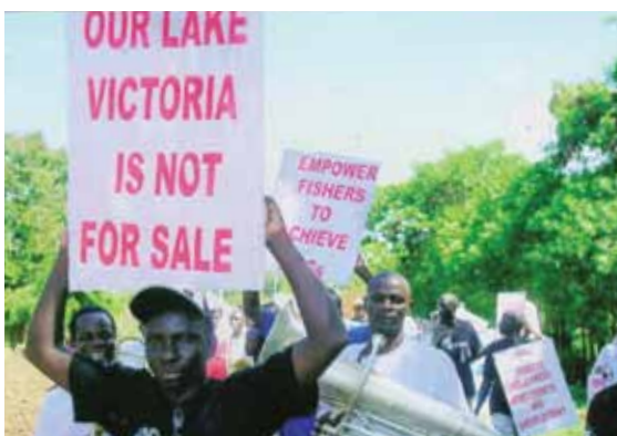
L'accaparement des mers inflige la souffrance aux communautés de pêcheurs artisans

Pour plus d'informations, voir le rapport sur l'accaparement des mers. Visitez : www.worldfishers.org ou demandez une copie à Masifundise.