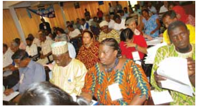
Les délégués à l'Assemblée Générale de WFFP au Sri Lanka en 2007

L'AG se tient dans un pays différent chaque fois