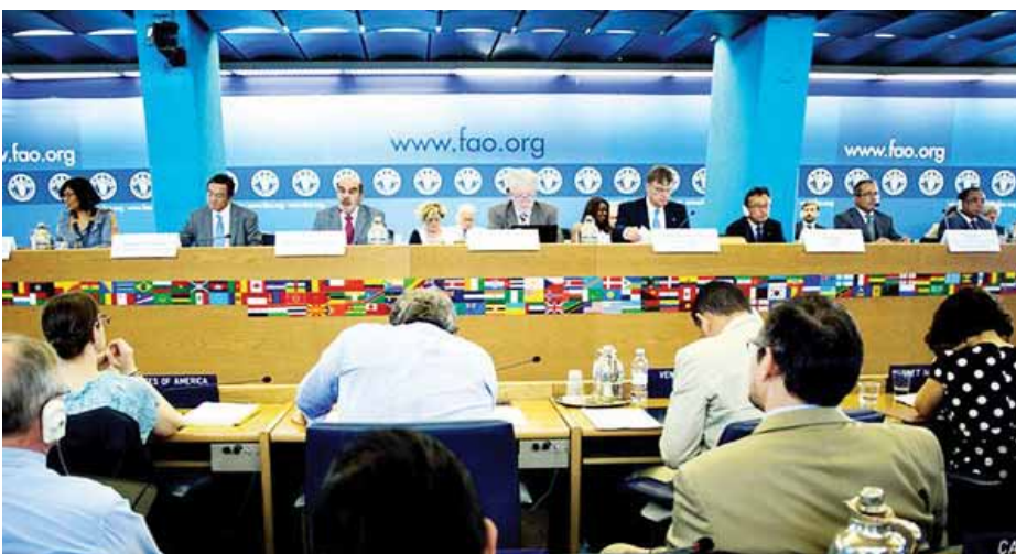
Les délégués se sont réunis pour une réunion de la commission de la pêche tenue plus tôt cette année à Rome pour débattre des directives internationales.

Masifundise et coordonnateur du WFFP, les Directives volontaires garantissent les droits fondamentaux de l'homme pour les pêcheurs artisans partout du monde entier car elles ont été adoptées par les gouvernements à l'Organisation des Nations unies (ONU) pour l'alimentation et l'agriculture (FAO). Il revient maintenant aux pays membres de les appliquer.