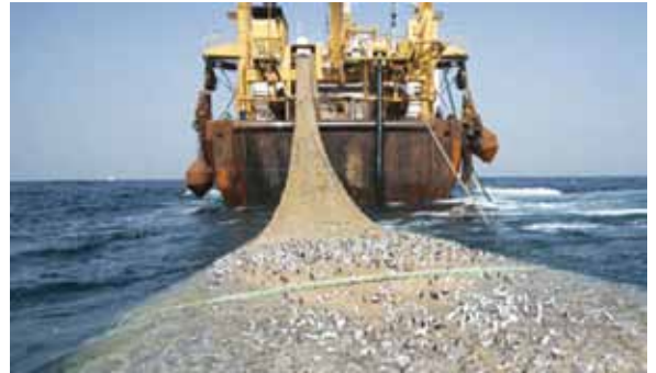
Surpêche le long de la côte occidentale d'Afrique

L'accaparement des ressources naturelles est rendu possible par les politiques néolibérales menées et acceptées par les nations-états dans le monde. Certaines de ces politiques prennent la forme d'accords commerciaux et d'investissement entre deux ou plusieurs États. C'est grâce à ces types de